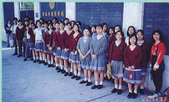
陽光學生活動計劃 (上)探訪路德會啟聾學校 (下)參與梅里臨屋嘉年華環保活動