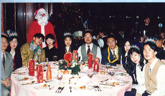
首次參加聖誕舞會 嶺南學院在校同學 左及右：