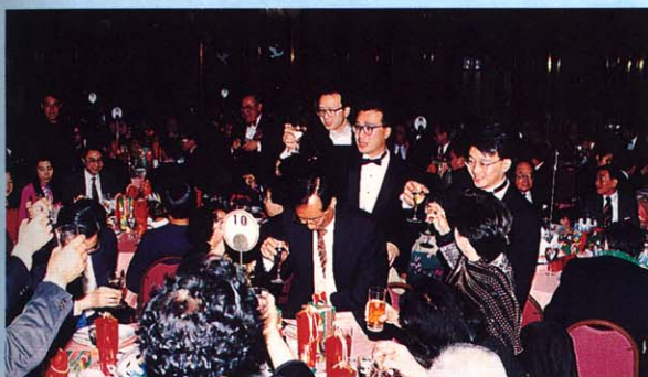
酌籌交錯共慶佳節