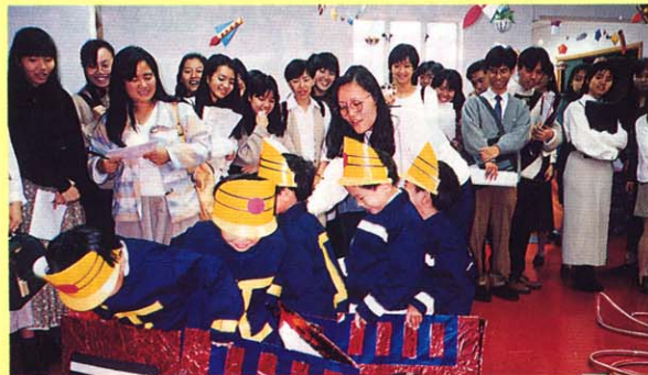
羅富國教育學院參觀小朋友“救火遊戲”活動