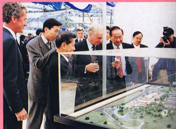
彭定康監督參觀新校園模型