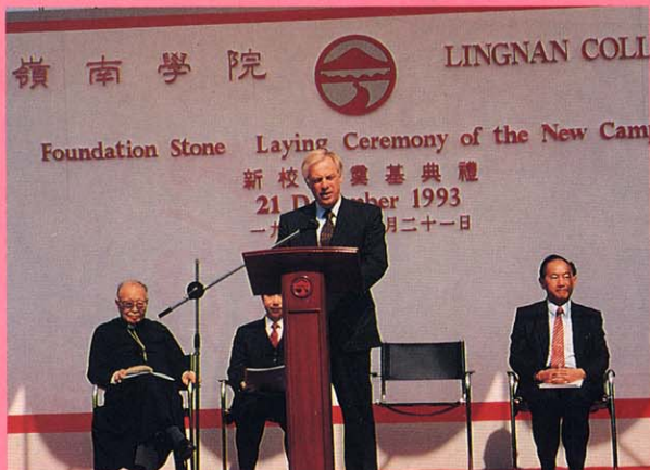
彭定康監督主持奠基典禮