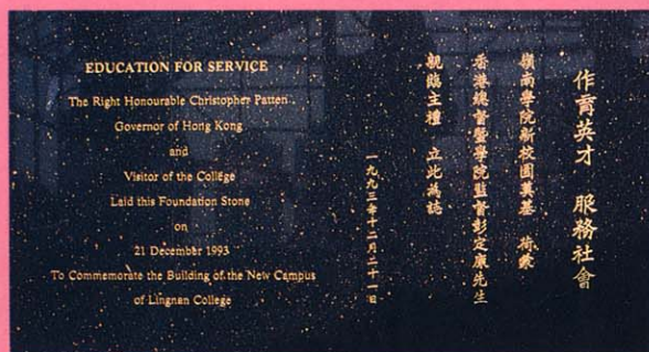
新校園奠基典禮紀念碑石