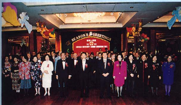
舞會開始全體肅立唱《校歌》