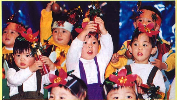
幼兒園兩歲小朋友表演“嶺南是好臘燭”