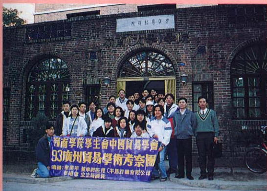
(上)中國貿易學會訪問廣州 參觀嶺南(大學)學院