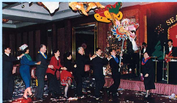
舞瑞龍子夜報佳音