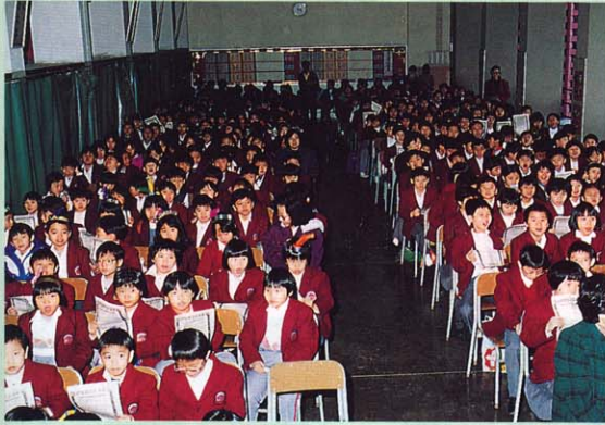
1993年12月21日舉行慶祝耶穌降生感恩崇拜，上下兩圖為會場一瞥。