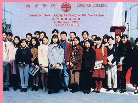
學生代表出席奠基典禮儀式