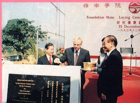
彭定康監督安放碑石