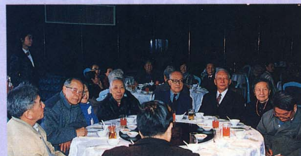
到會的部分年長同學