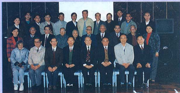
三院士與年長同學合映