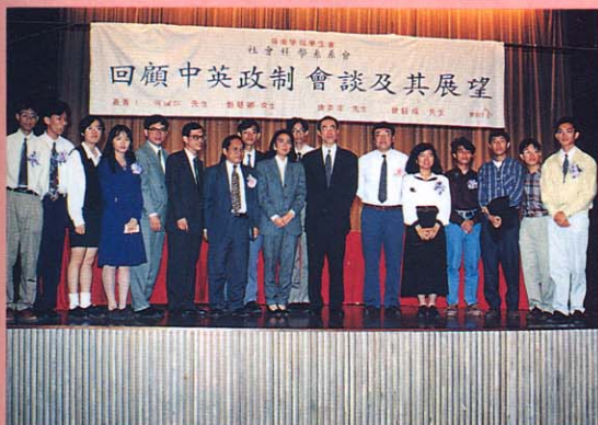
(上)社會科學系舉辦講座 籌委會與嘉賓合映。