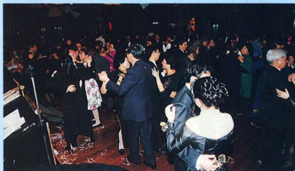
歡樂滿堂婆婆起舞